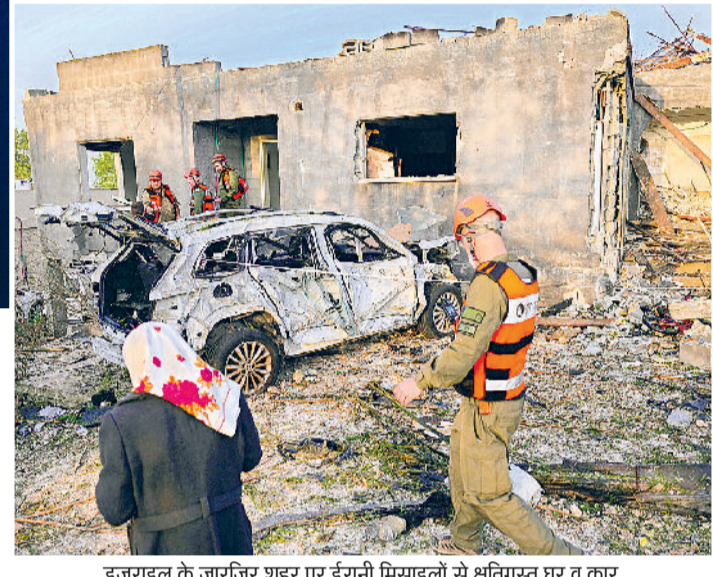
इजराइल के जारजिर शहर पर ईरानी मिसाइलों से क्षतिग्रस्त घर व कार

ईरान के सैन्य केंद्रीय मुख्यालय के प्रवक्ता ने दावा किया है कि पश्चिमी इराक में सक्रिय विद्रोही गुटों ने अमेरिका के एक सैन्य विमान को मिसाइल से मार गिराया है। यह विमान एक रिपब्लिकन विमान था। इस घटना में सवार सभी 6 सैनिकों की मौत हो गई है। ईरान के रिवालयनरी गार्ड कॉर्प्स (आईआरजीसी) के जनसंपर्क विभाग ने बयान में कहा गया कि रेंजिस्टर्स फ्रंट के एयर डिफेंस सिस्टम ने बोइंग केसी-135 स्ट्रैटोटेकर को उस समय निशाना बनाया, जब वह एक लड़ाकू विमान में ईंधन भर रहा था।