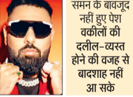
समन के बावजूद नहीं हुए पेश वकीलों की दलील-व्यस्त होने की वजह से बादशाह नहीं आ सके