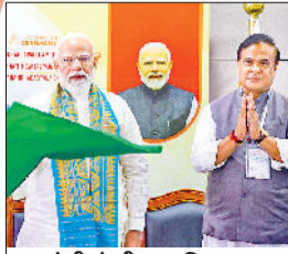
मोदी ने पीएम-किसान योजना की 22वीं किस्त देश के 9.3 करोड़ से अधिक किसानों को जारी की

बारिश के कारण यात्रा कार्यक्रम में बाधा आने के बाद गुवाहाटी से 'डिजिटल' असम के कोकराझार में जनसभा को संबोधित करते हुए मोदी ने कहा कि राज्य 'डबल इंजन' सरकार के तहत शांति एवं विकास का एक नया अध्याय लिख रहा है। मोदी ने आरोप लगाया कि कांग्रेस ने स्वदेशी लोगों की जमीन घुसपैठियों को सौंपकर राष्ट्रीय सुरक्षा को खतरे में डालने का काम किया। आगामी चुनावों में कांग्रेस को रूढ़ित करे और यह स्पष्ट संदेश दें कि देश में घुसपैठियों के लिए कोई जगह नहीं है।