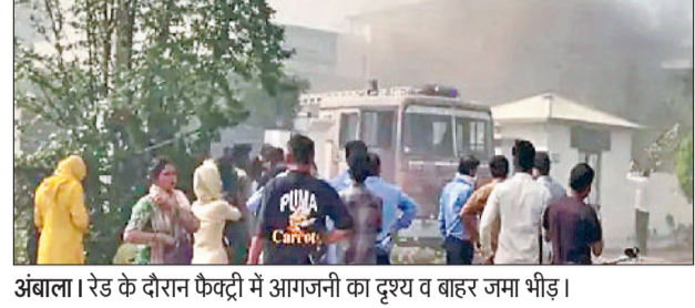
अंबाला। रेड के दौरान फैक्ट्री में आगजनी का दृश्य व बाहर जमा भीड़।