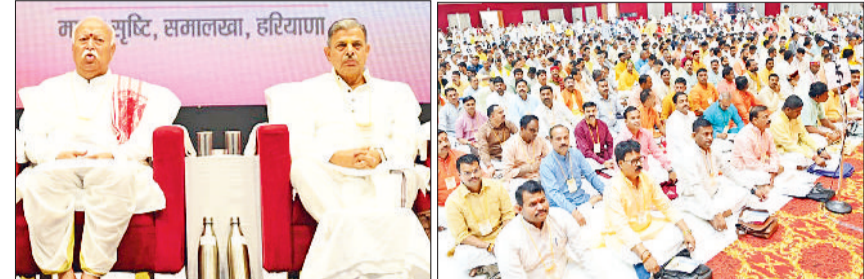
पानीपत। मंचासीन सरसंघचालक डॉ. मोहनराव भागवत व सरकार्यवाह दत्तात्रेय होसबाले और उपस्थित पदाधिकारी।